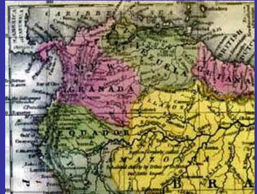
República de Nueva Granada (1830-1861)